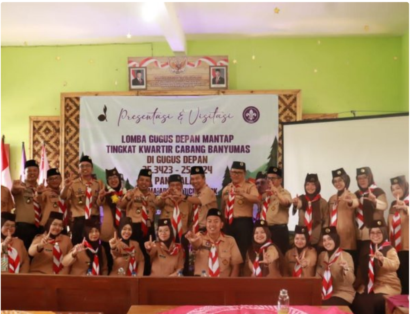
Satya Darma MA Ma'arif NU 1 Cilongok jadi Tuan Rumah Visitasi Gudep Mantap Kwartcab Banyumas

CILONGOK - MA Ma'arif NU 1 Cilongok, Banyumas, Jawa Tengah, kembali meneguhkan perannya sebagai madrasah penggerak kepramukaan.